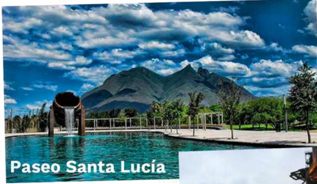
Paseo Santa Lucía